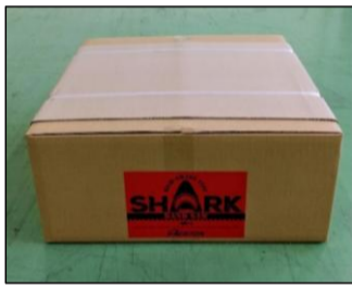
①ラベル テープに対して垂直の位置