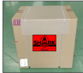
②ラベル=中央へ サイズラベル=左下へ