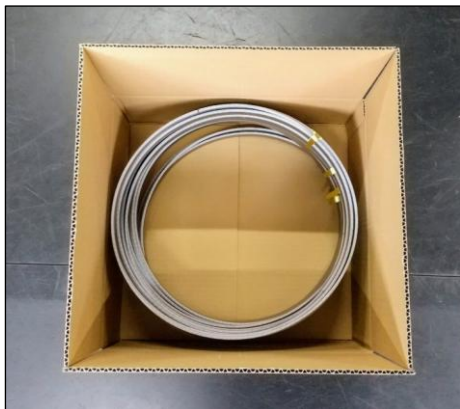
現行梱包形態……中身が平入れ

バンドソーを上に重ねて入れる箱形状で、 在庫数がわかりづらく取り出す際扱いづらい