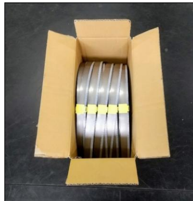
新梱包形態……中身が縦入れ